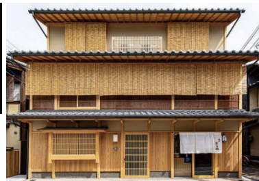
〈祇園下河原、大正九年創業、祇園むら田様〉

胡麻の中で最も高品質と言われるグアテマラ産原料を厳選し、下皮をむいて丁寧に煎り上げたその胡麻は、色がキラキラと輝いています。香りが非常に素晴らしい!すりたての風味は格別!まずは酢飯にかけてみてください。錦糸のりは、厳選した国産海苔を焼き上げ、針のように裁断してあり、ごく少量でも海苔の風味を味わえます。京都・菊乃井をはじめとした全国の名だたる有名料亭で選ばれています。