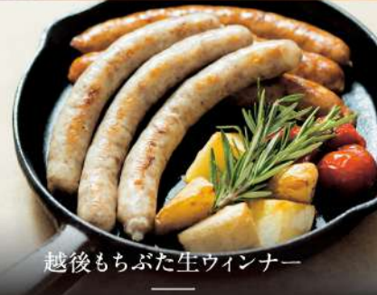
越後もちぶた生ウィンナー

素材の味とサカガミのこだわりがギュッと詰まったハム工房の商品を、 是非お召し上がりください。