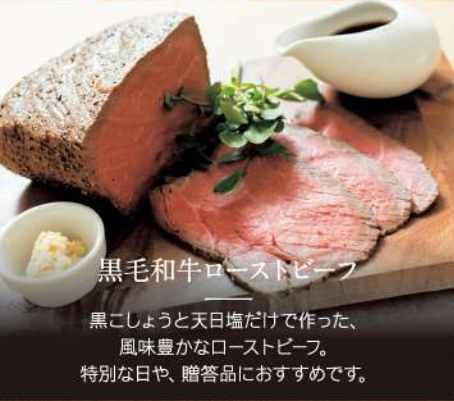
黒毛和牛ローストビーフ

黒こしょうと天日塩だけで作った、 風味豊かなローストビーフ。 特別な日や、贈答品におすすめです。