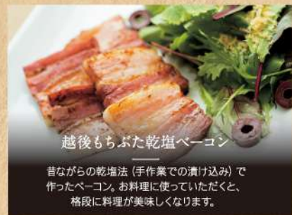
越後もちぶた乾塩ベーコン 昔ながらの乾塩法(手作業での漬込み)で作ったベーコン。お料理に使っていただくと、格段に料理が美味しくなります。

■ハム工房 越後もちぶたバラエティセット [435-06]...5,200円 税込